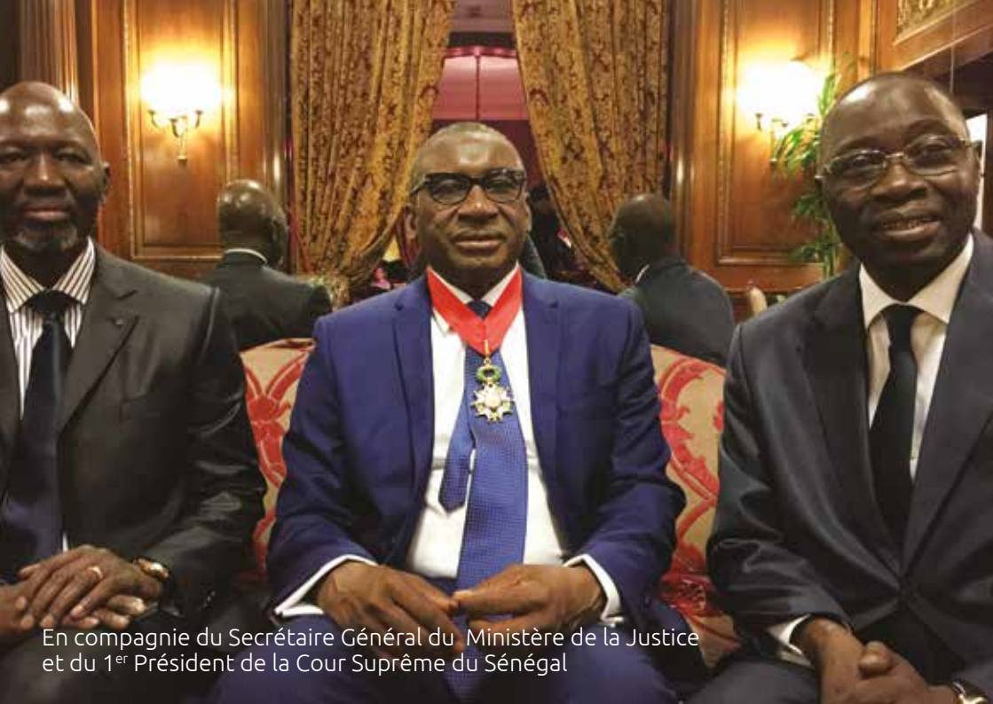
En compagnie du Secrétaire Général du Ministère de la Justice et du 1 er Président de la Cour Suprême du Sénégal