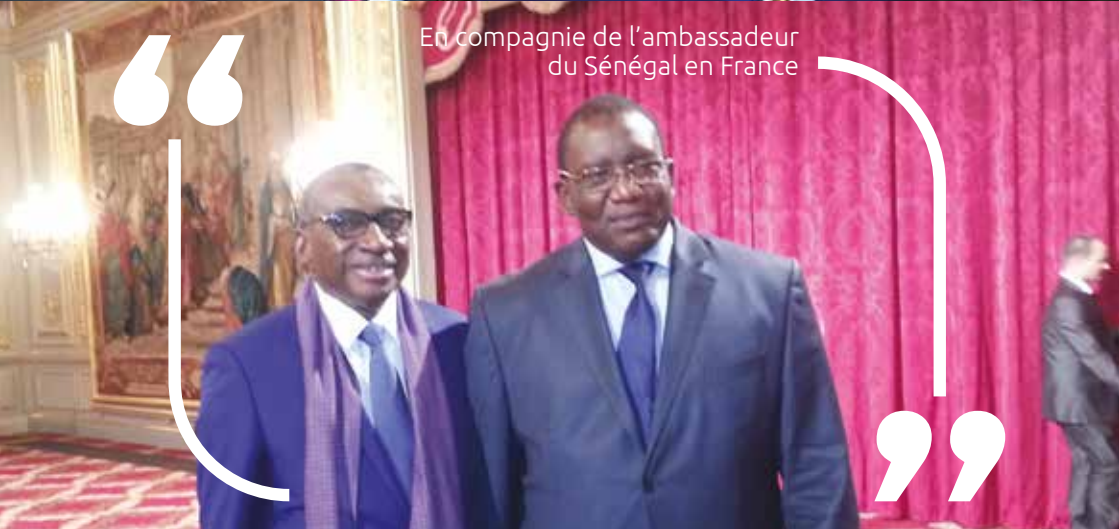
En compagnie de l'ambassadeur du Sénégal en France