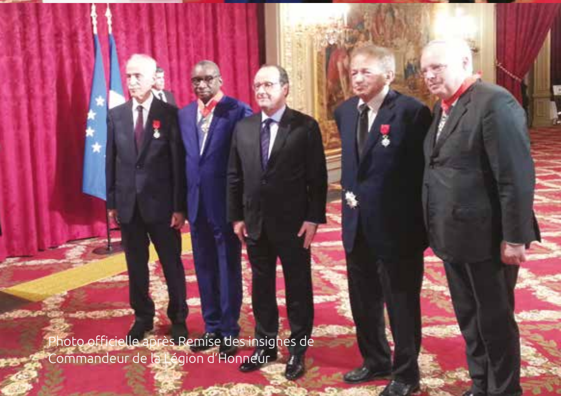
Photo officielle après Remise des insignes de Commandeur de la Légion d'Honneur